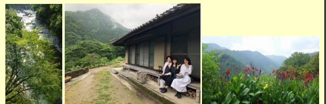
* 縁側で三時間くらい過ごす方も多いのだそうです。

「五つ星ホテル以上の、日本一粗末な宿」と紹介されたことがある宿なんです(のり)。付け加えるなら「忘れられない宿」(あん)。