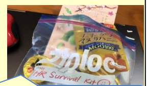
お客様からいただいた、「HR サバイバルキット」。闘えそうです。笑

※2021年3月までに予定されている公開セミナーは弊社サイト( http://an1139.blog.fc2.com/ )でもご案内しています。