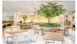
*写真は似た雰囲気イメージです

※皆様のところの社員の方々は、ちゃんとご飯食べて、ちゃんとお風呂に入ってちゃんと寝ていますか？モチベーションやらエンゲージメントやら、人事屋はとかく難しく考えがちですが、人が頑張れる礎ってこういうことだと思いませんか？